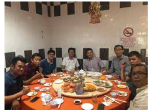
Pantai Remis Lunch