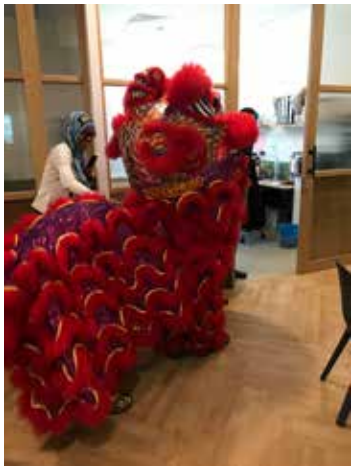
Lion Dance with CG